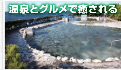
温泉とグルメで癒される

マラソン大会がよく開催されている伊豆大島。初心者でも安心して楽しめる、海岸沿いのサンセットバームラインでは、富士山や海に沈む夕日を眺めることができます。