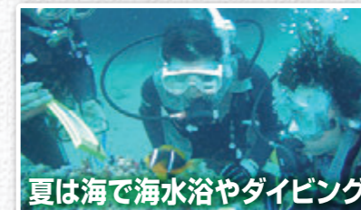
夏は海で海水浴やダイビング

透き通った海中では、カラフルな魚たちがお出迎え。トウシキ海岸、日の出浜、秋の浜など、磯遊びから本格的なダイビングまで幅広く楽しめるスポットが伊豆大島にはたくさんあります。