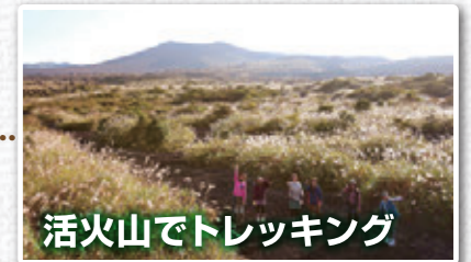
活火山でトレッキング

透き通った海中では、カラフルな魚たちがお出迎え。トウシキ海岸、日の出浜、秋の浜など、磯遊びから本格的なダイビングまで幅広く楽しめるスポットが伊豆大島にはたくさんあります。