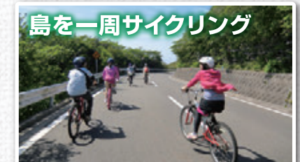
島を一周サイクリング

日本で唯一「砂漠」と呼ばれる場所「裏砂漠」。一面に広がる黒い大地は、まるで異世界に来たような感覚を味わえます。