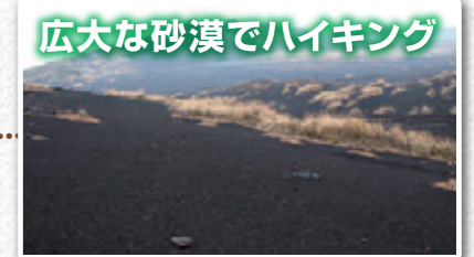
広大な砂漠でハイキング

伊豆大島の中央に位置する三原山は、標高758mの活火山です。スケールの大きい火口の周りには遊歩道があり、伊豆の島々から伊豆半島、富士山を見渡すことができます。