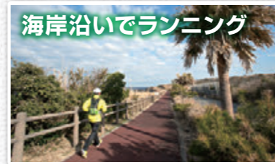
海岸沿いでランニング

高速船なら1時間45分で行ける東京の島・伊豆大島。ちょっとしたお散歩から、本格的なランニングやサイクリングまで、楽しみ方はあなた次第で広がります。都心では味わえないリフレッシュをに、伊豆大島へ遊びにきませんか?